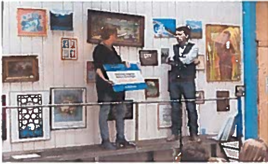
Feestelijke uitreiking Cheque Mamaminifonds

Naast de noodzakelijke bijdragen van fondsen ontvangen wij ook regelmatig donaties. Zo hebben we een donatie ontvangen van de organisatie Valthe-Groningen-Valthe . Deze organisatie organiseert elk jaar een fietstoertocht waarbij de opbrengst naar een beperkt aantal goede doelen gaat. SUN Groningen heeft afgelopen jaar van hen tijdens een feestelijke bijeenkomst een cheque mogen ontvangen. Verder hebben we een gift ontvangen van het Goede doelen fonds van de ambtenaren van Groningen SOZAWE. Hiernaast ontvangen we regelmatig giften van donateurs, ingezameld bij een afscheid of jubileum en giften van kerken (in 2016 Zuidhorn en Hoogkerk ). De opbrengst van een kerstactie van medewerkers van Zorgbelang Groningen werd door hen voor SUN Groningen bestemd. Deze goede gaven worden door ons erg gewaardeerd.